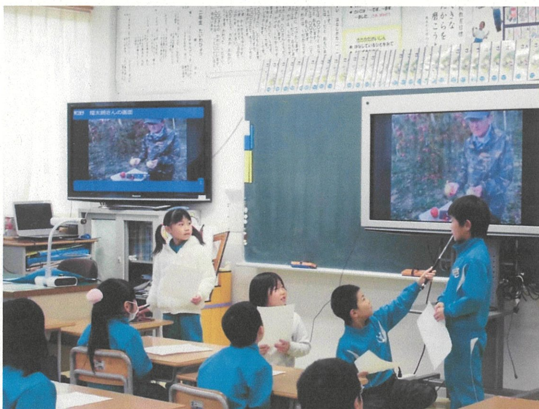
I C T 機器を活用した授業【晴山小学校】