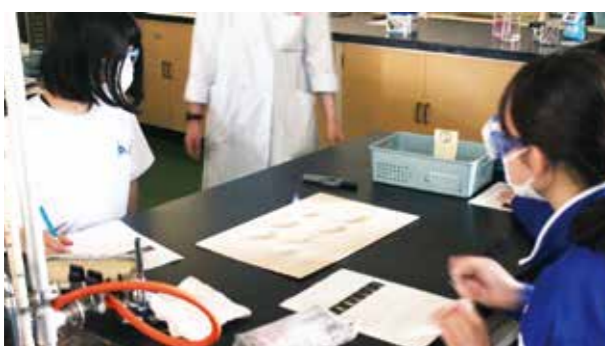
楽しく実験を行いました