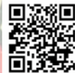
楽天ふるさと納税