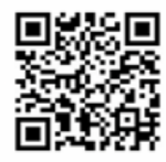
ふるさとチョイス