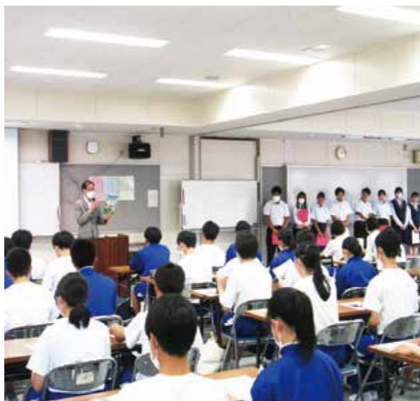
学校説明を真剣に聞く中学生

中学生の感想では「化学の炎色反応の実験が不思議だった」、「2進法の内容をわかることができて面白かった」、「プログラミングし