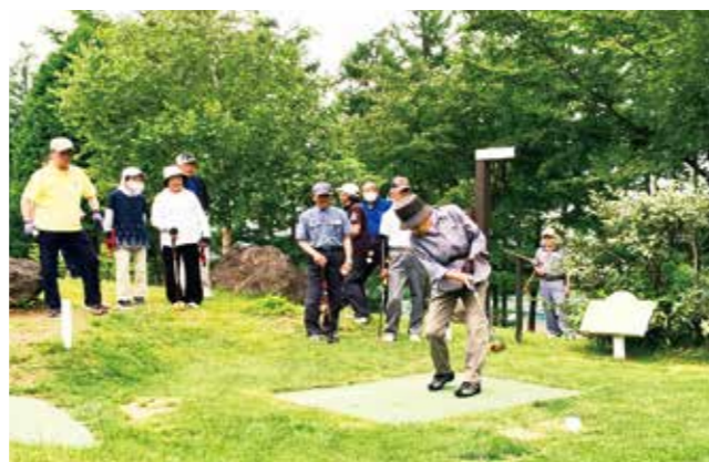
天気もよくパークゴルフ日和となりました

第45回軽米町総合体育大会パークゴルフ競技が7月9日にハートフルスポーツランドで開催され、15チーム87人が参加しました。3ブロックに分かれて勝負を競い、Aブロックは本町、Bブロックは上新町、Cブロックは向川原がそれぞれ1位となりました。参加者は和気あいあいと楽しみながらプレーしていました。