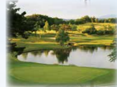
ニュー軽米カントリークラブ 平日プレーご優待券