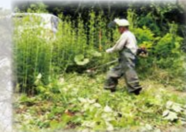
軽米町シルバー人材センター 草刈り作業サービス(機械使用、2時間)