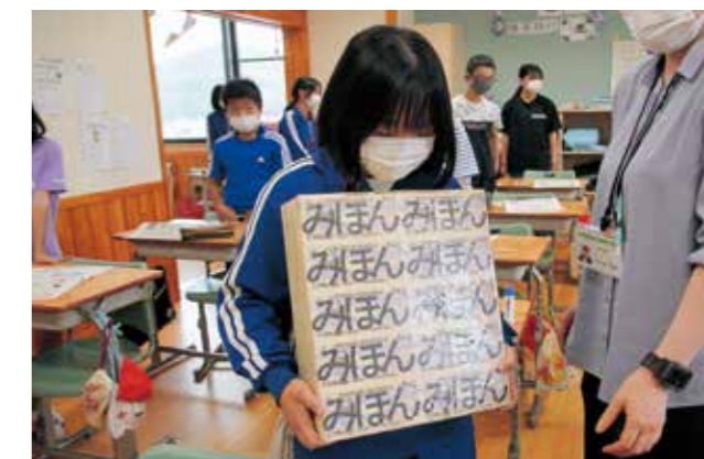
約10kgある1億円レプリカで重さを体感しました

軽米小学校の租税教室が7月19日に行われ、6年生30人が税についての理解を深めました。児童はいろいろな種類の税があることに興味を持っていました。アニメを見て税の使い方や社会に果たす役割について学んだ後、重さ約10kgの1億円のレプリカを持つと「重い!」と驚いていました。