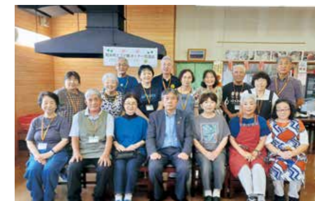
エゴマ畑オーナー会員と楽しく交流しました

軽米町エゴマ畑オーナー交流会が7月21日から23日まで行われ、関東圏から14人のエゴマ畑オーナーが来町しました。エゴマ畑で葉摘み体験をし、収穫した葉は天ぷらやサンドイッチにして味を確かめました。22日にはミレットパークでのバーベキュー、梅やブルーベリーのジャム作り体験で軽米を満喫しました。