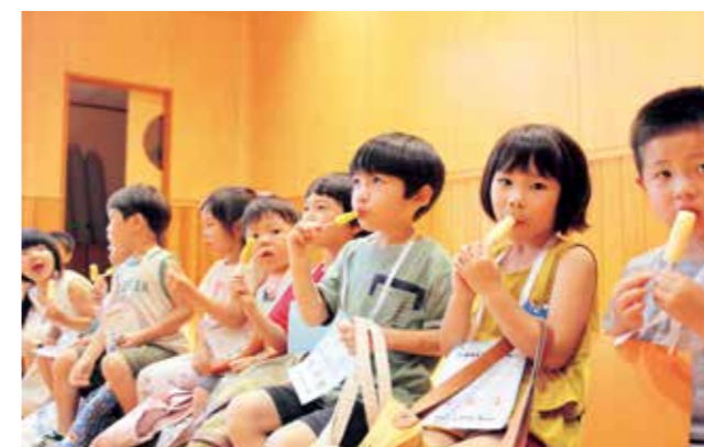
アイスを頬張る園児たち

晴山保育園の縁日ごっこが7月25日に行われ、園児34人が参加しました。ボールすくいやくじ引きなどをして、お祭り気分を楽しみました。園児たちは、くじ引きで取った景品をみんなで見せあいながら、アイスを楽しそうに頬張っていました。みんなに感想を聞くと「とても楽しい」とにこにこしていました。