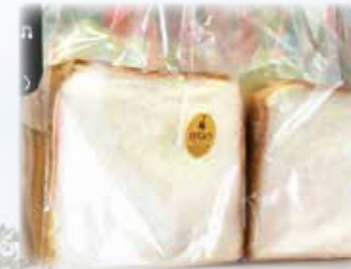
まるこパン工房コパン 食パン食べ比べ2斤セット