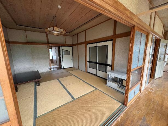
【和室 (10 帖)】