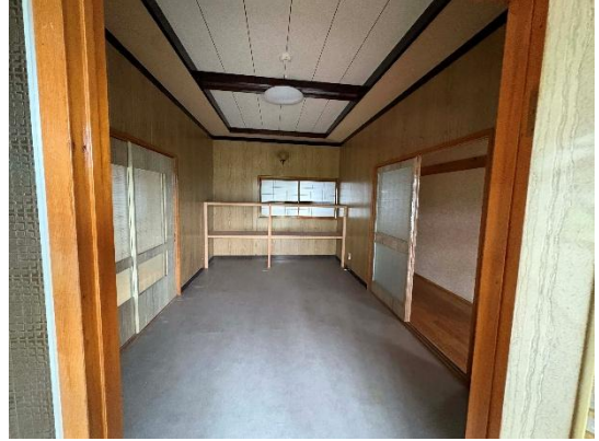
【洋室 (7 帖)】