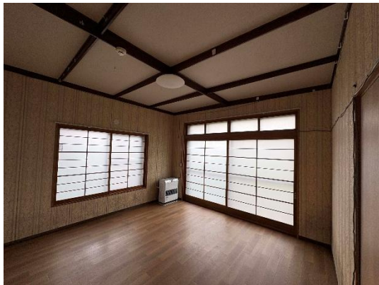
【洋室 8 帖】