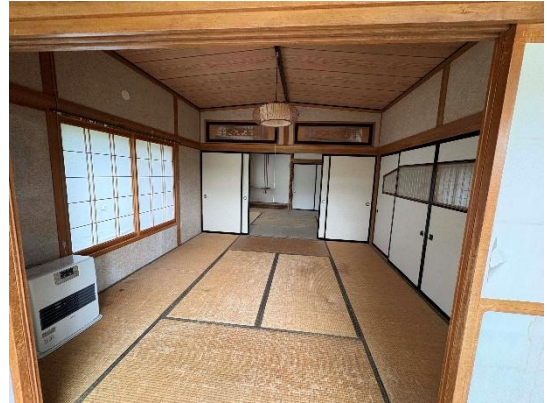
【和室 (8 帖)】