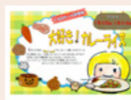
このポップが目印!

1月22日は“カレーの日”です。聞いただけで無性にカレーが食べたくなってしまう方も多いのでは? 今月は、もはや国民食といえるカレーのひみつやアレンジメニューがのった本などを用意しました。おいしいカレー作りにお役立てください!