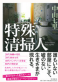
特殊清掃人 著/中山七里 (朝日新聞出版)

誰もいない部屋にこそ現れる、偽りのない生き様。特殊清掃業者に押し寄せる依頼。彼らの仕事をとおして、人々が抱えている事情が浮かび上がる。