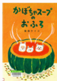
かぼちゃ スープの おふろ 作/柴田ケイコ (小学館)