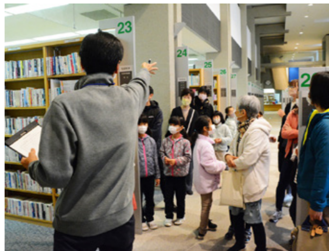
フロアの説明を受ける参加者