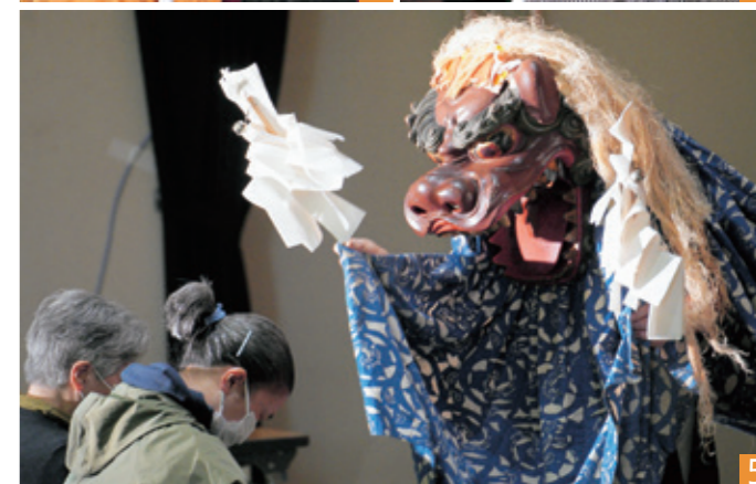
1_県立軽米高校吹奏楽部 2_根反鹿踊り保存会 3_沢田神楽保存会による権現舞 4_山内神楽保存会による三坊荒神 5_太神楽