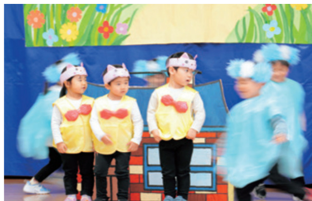
花のまちこども園くま組による「3びきのこぶた」

昨年12月1日から24日にかけて、町内こども園・保育園で発表会が行われました。園児たちは大勢の視線と多数のカメラを前に物おじせず、目いっぱい演技や息を合わせた演技を披露しました。頑張りを認めてくれたと感じ取った園児たちの中には、幕が閉じ切るまで観客席に手を振り続ける子も見られました。